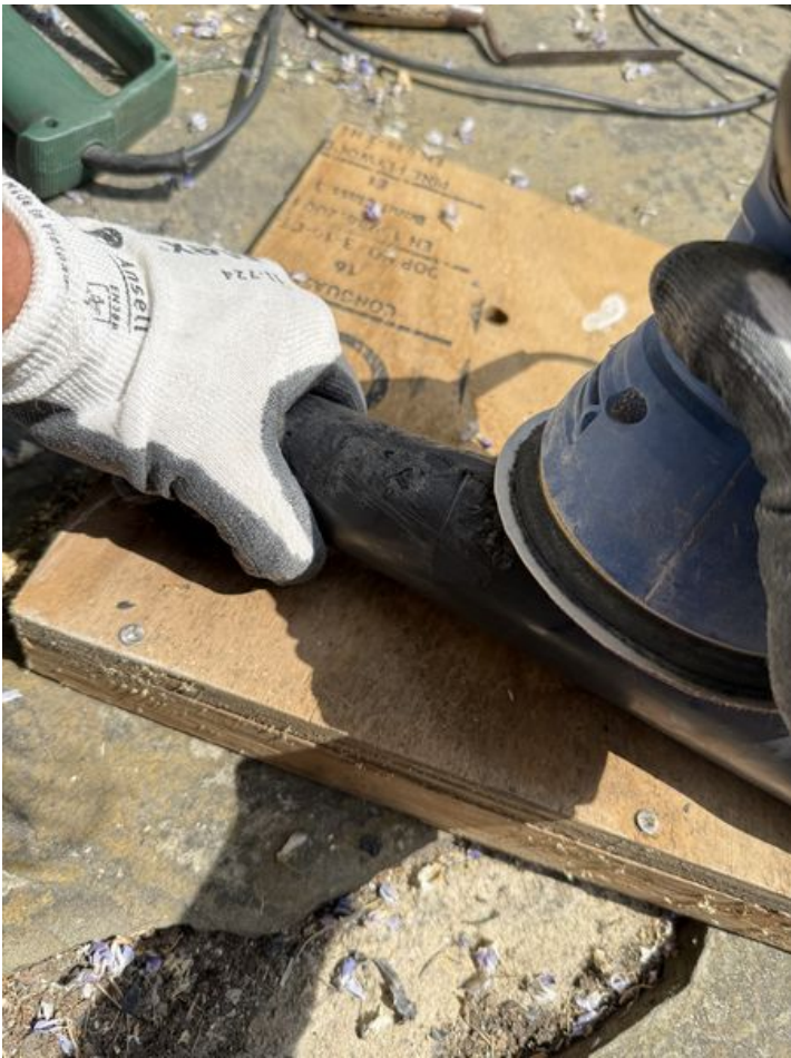
Taille de cet aperçu : 450 × 600 pixels. Fichier d'origine (4 284 × 5 712 pixels, taille du fichier : 4,47 Mio, type MIME : image/jpeg) Murmur_num_ro_1_IMG_1906