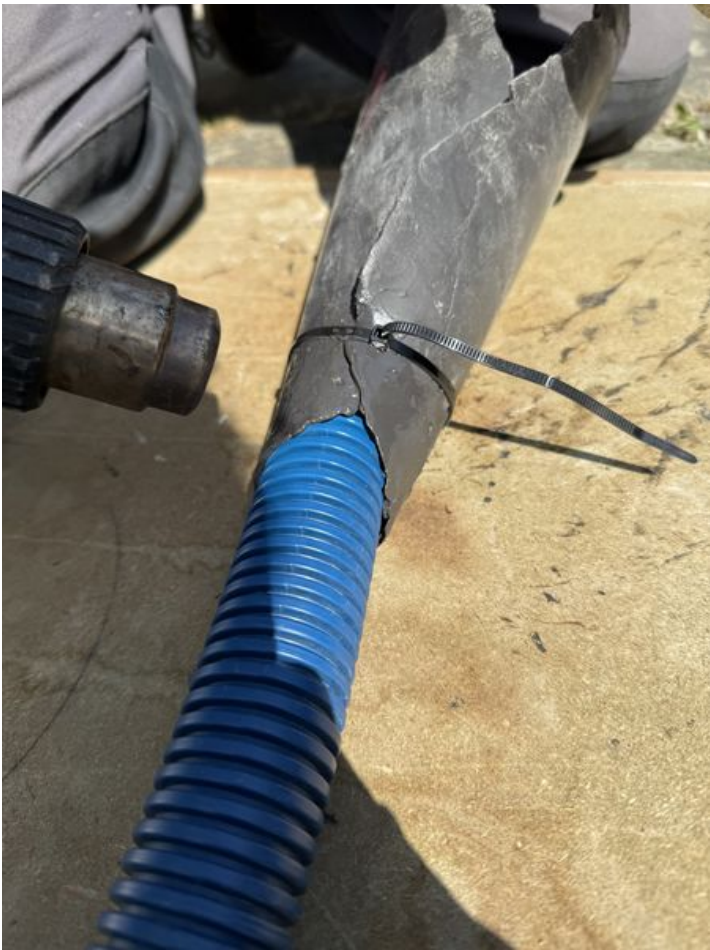
Taille de cet aperçu : 450 × 600 pixels. Fichier d'origine (4 284 × 5 712 pixels, taille du fichier : 3,97 Mio, type MIME : image/jpeg) Murmur_num_ro_1_IMG_1763