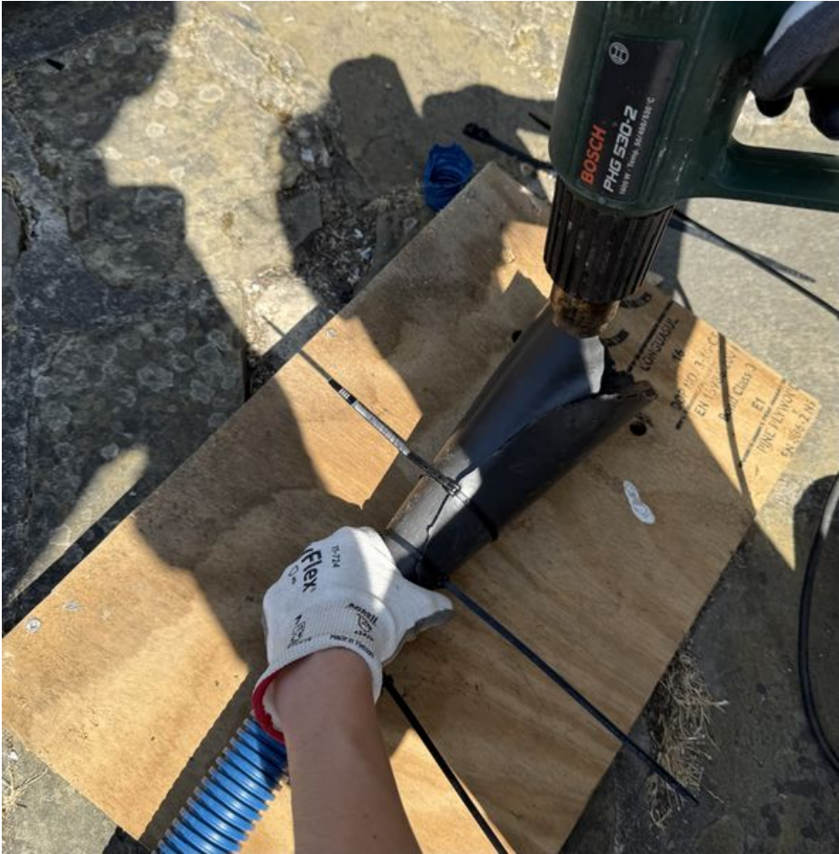
Taille de cet aperçu :590 × 600 pixels. Fichier d'origine (3 871 × 3 935 pixels, taille du fichier : 2,49 Mio, type MIME : image/jpeg) Murmur_num_ro_1_IMG_1629