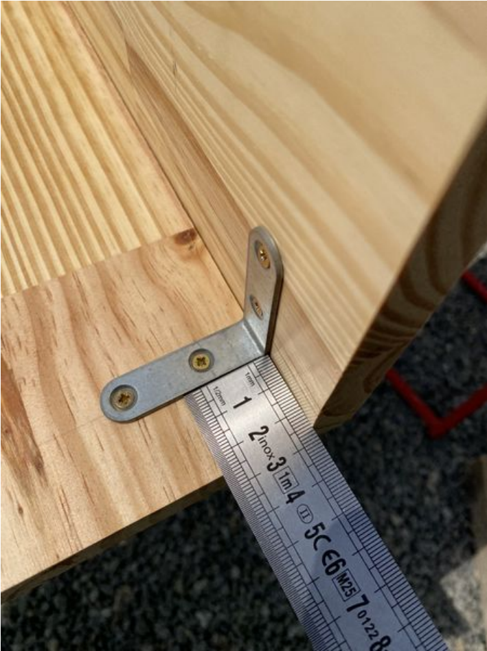
Taille de cet aperçu : 450 × 600 pixels. Fichier d'origine (3 024 × 4 032 pixels, taille du fichier : 2,63 Mio, type MIME : image/jpeg) Mise en place des équerres de chaise