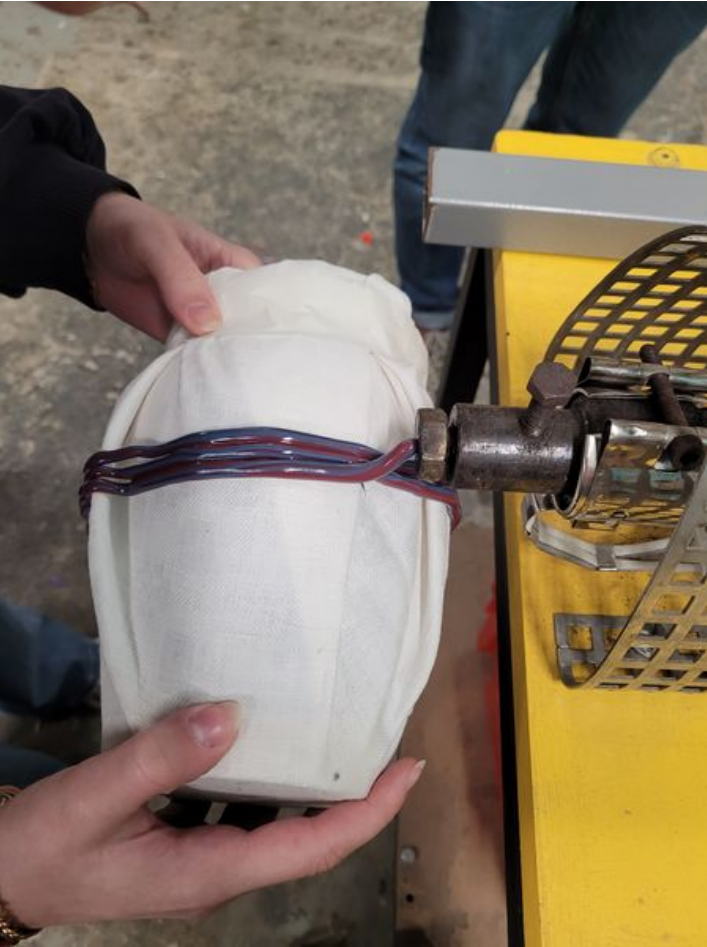
Taille de cet aperçu : 450 × 600 pixels. Fichier d'origine (3 024 × 4 032 pixels, taille du fichier : 3,36 Mio, type MIME : image/jpeg) La_Jardini_re_grimpante_20250401_103717