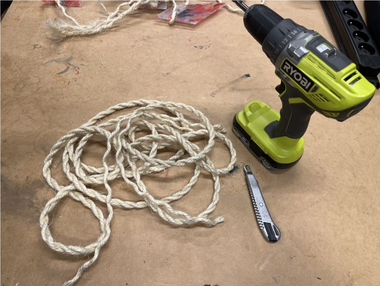
Taille de cet aperçu : 800 × 600 pixels. Fichier d'origine (4 032 × 3 024 pixels, taille du fichier : 4,02 Mio, type MIME : image/jpeg) La_Jardini_re_grimpante_.IMG_4141