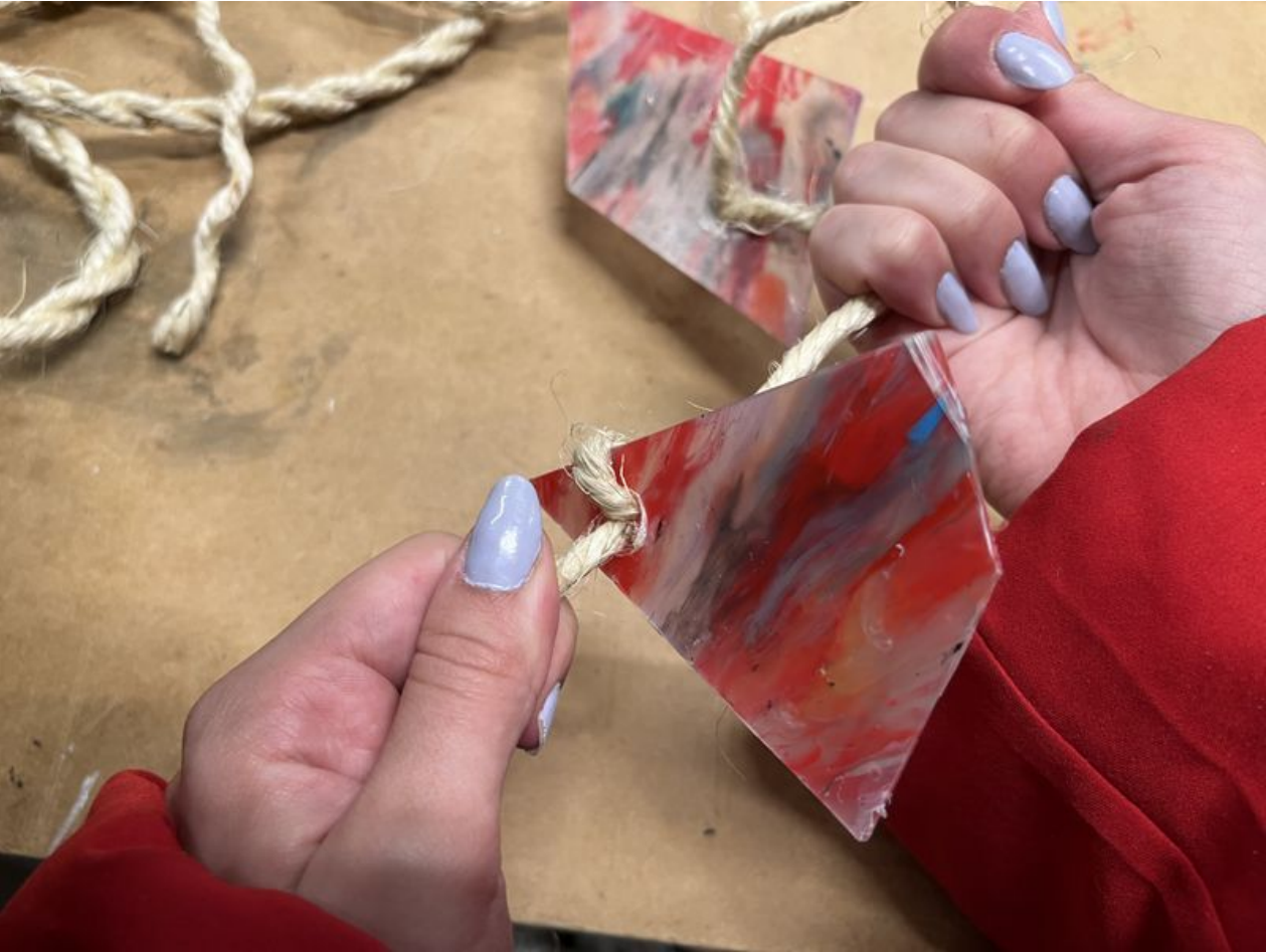
Taille de cet aperçu :800 × 600 pixels. Fichier d'origine (4 032 × 3 024 pixels, taille du fichier : 2,79 Mio, type MIME : image/jpeg) La_Jardini_re_grimpante_.IMG_4137