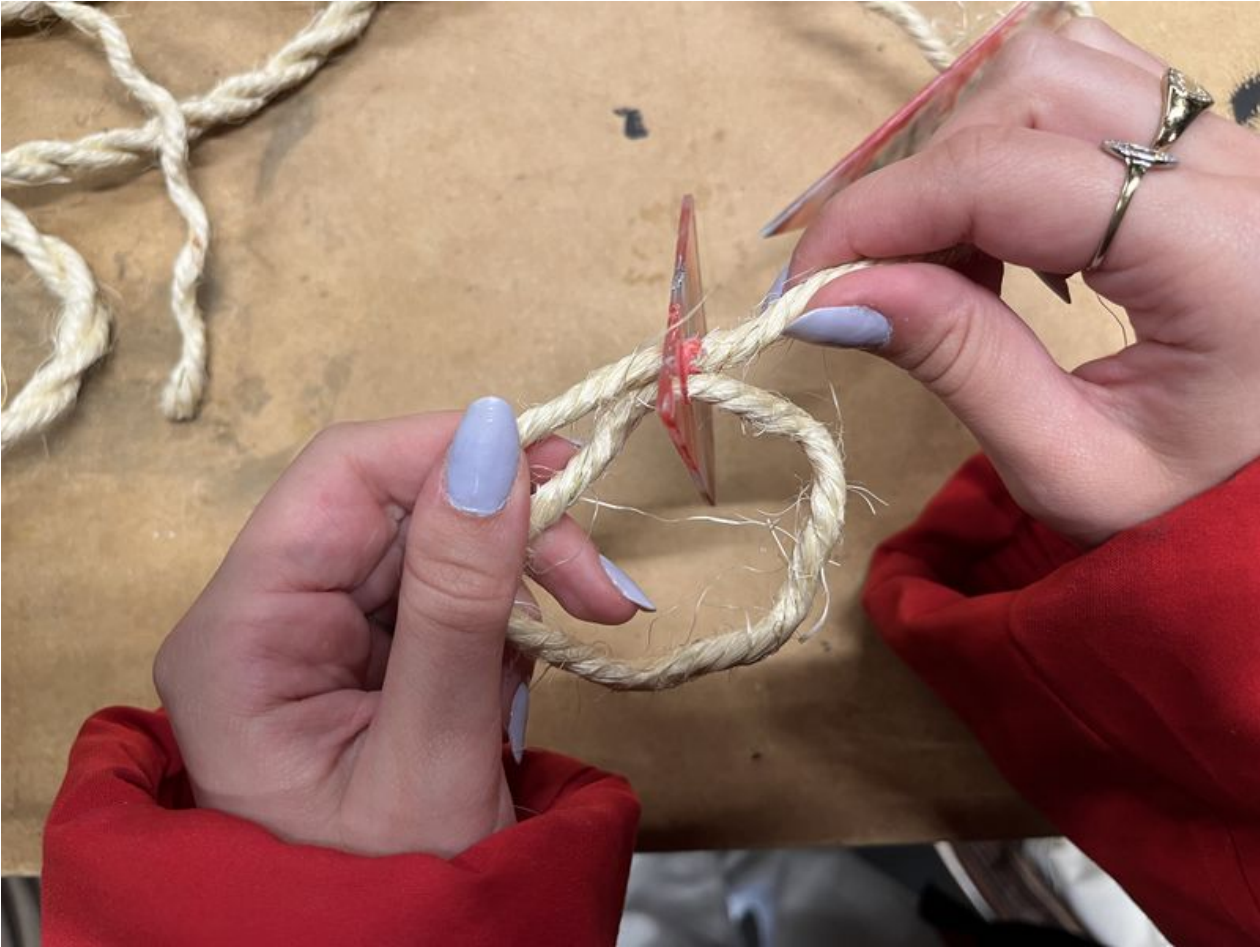
Taille de cet aperçu : 800 × 600 pixels. Fichier d'origine (4 032 × 3 024 pixels, taille du fichier : 2,81 Mio, type MIME : image/jpeg) La_Jardini_re_grimpante_.IMG_4133