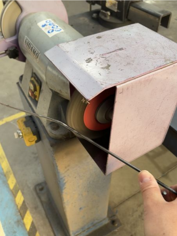
Taille de cet aperçu : 453 × 600 pixels. Fichier d'origine (1 179 × 1 561 pixels, taille du fichier : 351 Kio, type MIME : image/jpeg) l_oreille_urbaine_IMG_6825