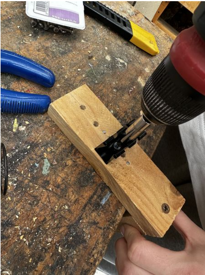
Taille de cet aperçu : 450 × 600 pixels. Fichier d'origine (3 024 × 4 032 pixels, taille du fichier : 3,25 Mio, type MIME : image/jpeg) Focalisation_pince_metallaique_