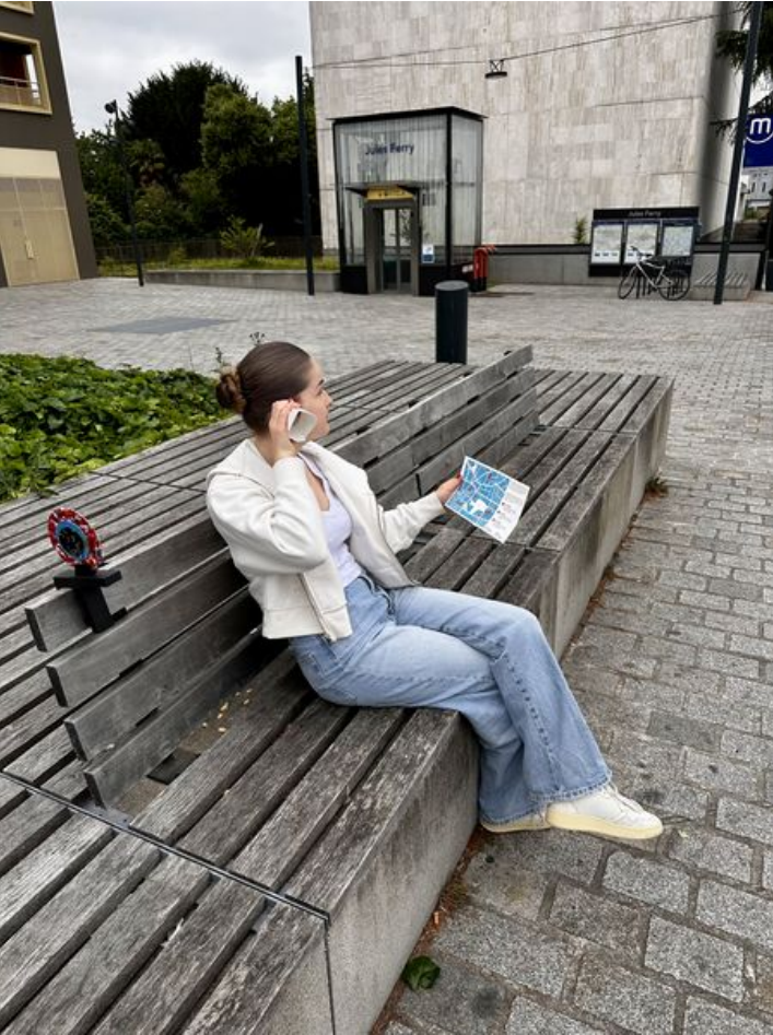
Taille de cet aperçu : 450 × 600 pixels. Fichier d'origine (3 024 × 4 032 pixels, taille du fichier : 4,65 Mio, type MIME : image/jpeg) Focalisation_IMG_3921