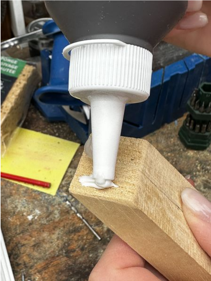
Taille de cet aperçu : 450 × 600 pixels. Fichier d'origine (3 024 × 4 032 pixels, taille du fichier : 1,63 Mio, type MIME : image/jpeg) Focalisation_IMG_3768