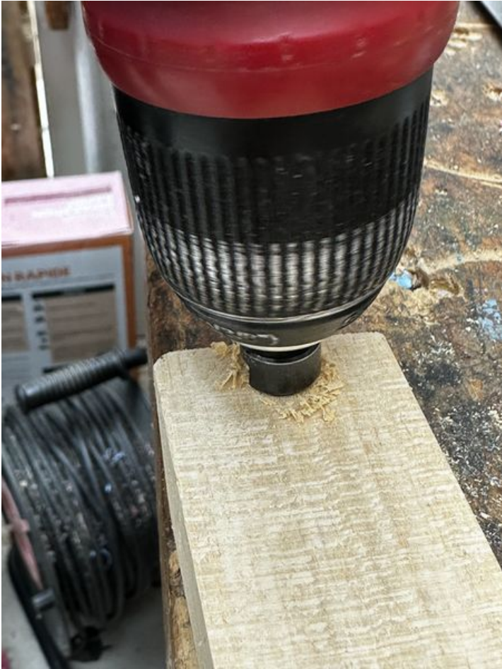
Taille de cet aperçu : 450 × 600 pixels. Fichier d'origine (3 024 × 4 032 pixels, taille du fichier : 1,9 Mio, type MIME : image/jpeg) Focalisation_IMG_3766