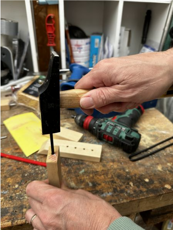
Taille de cet aperçu : 450 × 600 pixels. Fichier d'origine (3 024 × 4 032 pixels, taille du fichier : 1,98 Mio, type MIME : image/jpeg) Focalisation_IMG_3761