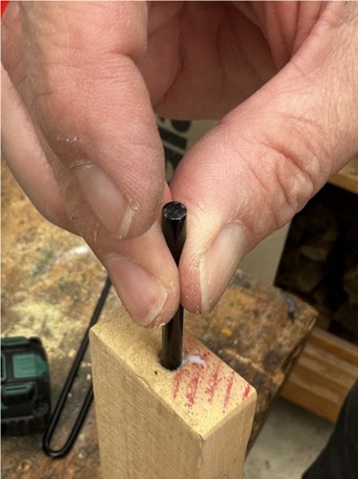
Taille de cet aperçu : 450 × 600 pixels. Fichier d'origine (3 024 × 4 032 pixels, taille du fichier : 1,59 Mio, type MIME : image/jpeg) Focalisation_IMG_3759