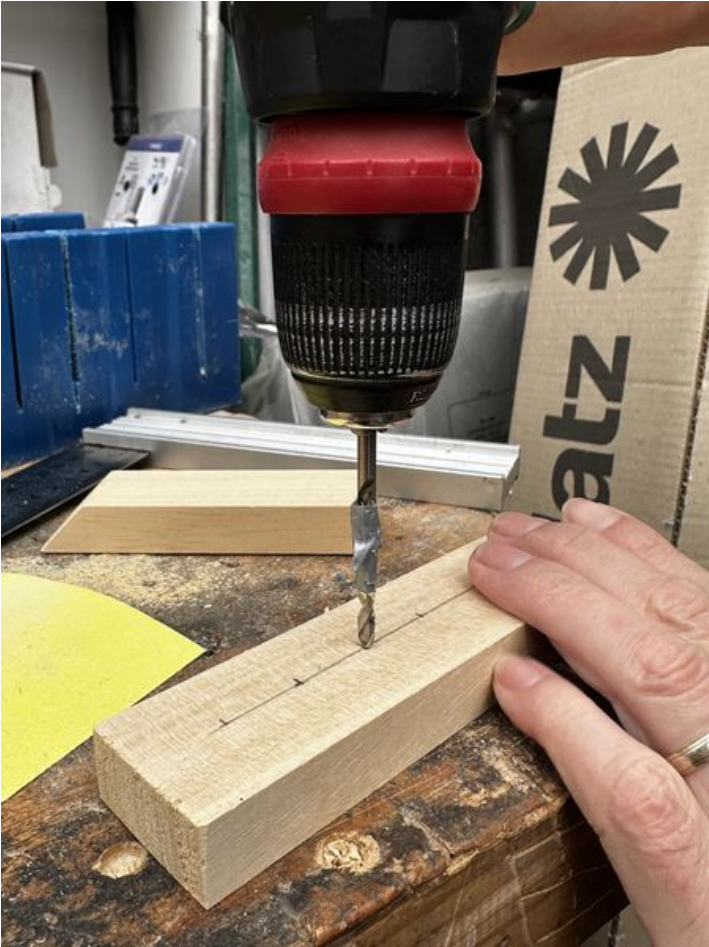
Taille de cet aperçu : 450 × 600 pixels. Fichier d'origine (3 024 × 4 032 pixels, taille du fichier : 2,21 Mio, type MIME : image/jpeg) Focalisation_IMG_3750