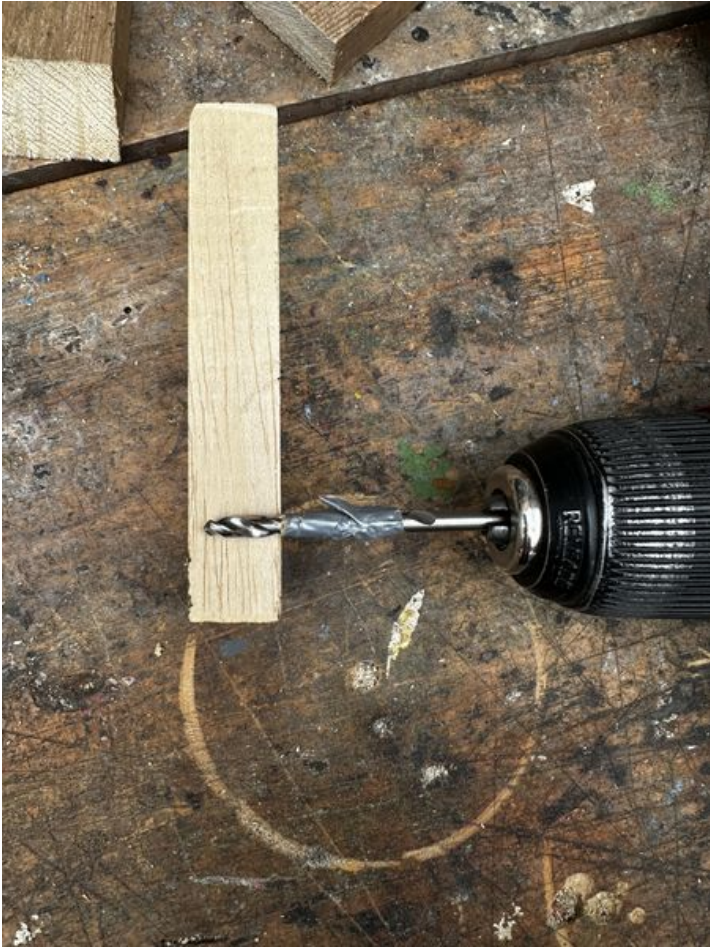
Taille de cet aperçu : 450 × 600 pixels. Fichier d'origine (3 024 × 4 032 pixels, taille du fichier : 3,93 Mio, type MIME : image/jpeg) Focalisation_IMG_3749