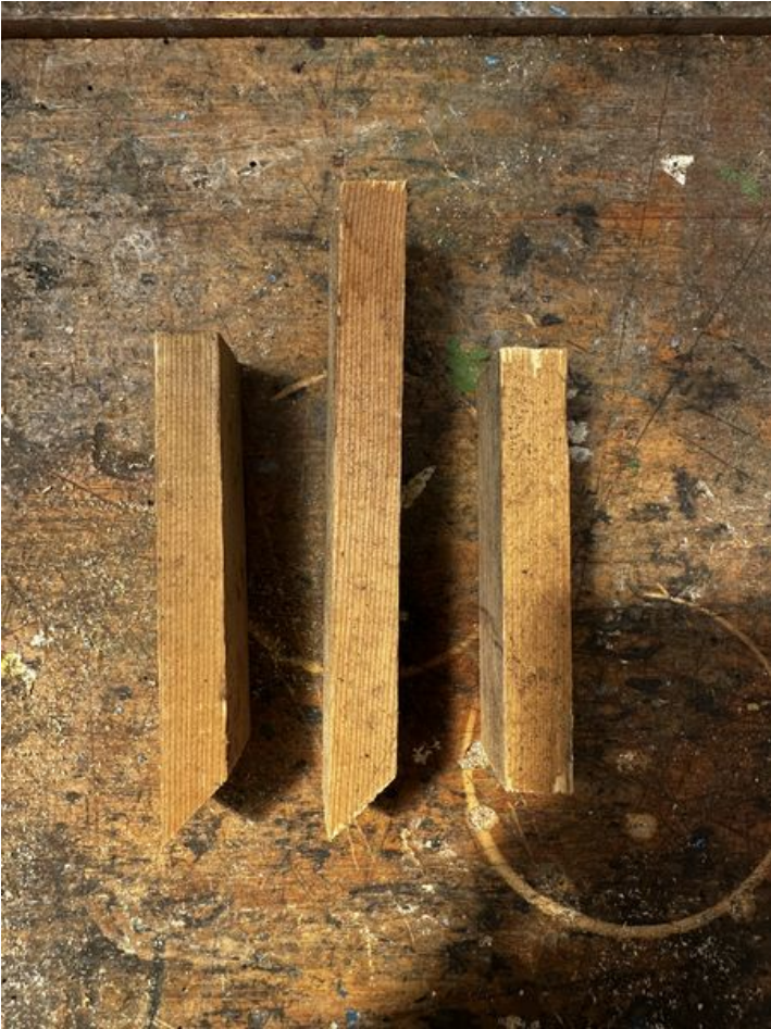
Taille de cet aperçu : 450 × 600 pixels. Fichier d'origine (3 024 × 4 032 pixels, taille du fichier : 4,08 Mio, type MIME : image/jpeg) Focalisation_IMG_3702