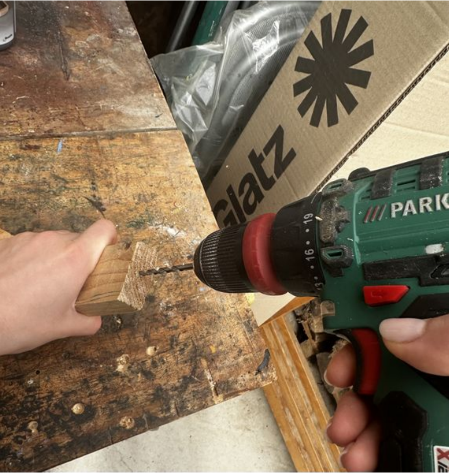
Taille de cet aperçu : 572 × 599 pixels. Fichier d'origine (3 022 × 3 165 pixels, taille du fichier : 1,95 Mio, type MIME : image/jpeg) Focalisation_IMG_3659