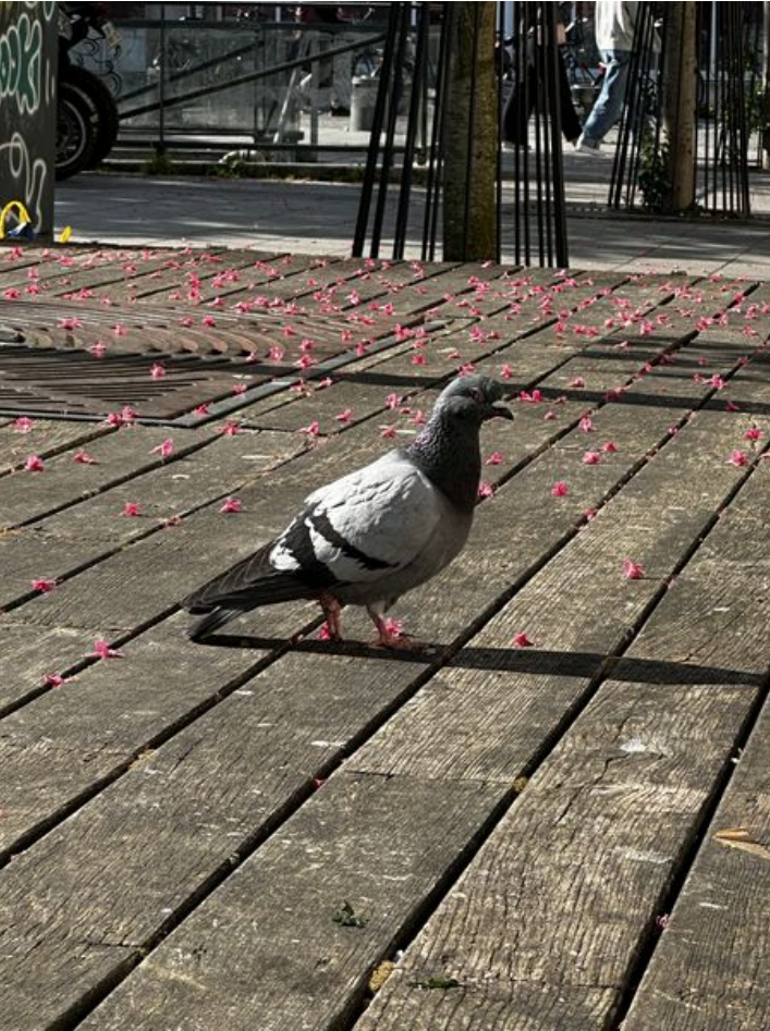
Taille de cet aperçu : 450 × 600 pixels. Fichier d'origine (3 024 × 4 032 pixels, taille du fichier : 4,18 Mio, type MIME : image/jpeg) Focalisation_IMG_3641_2