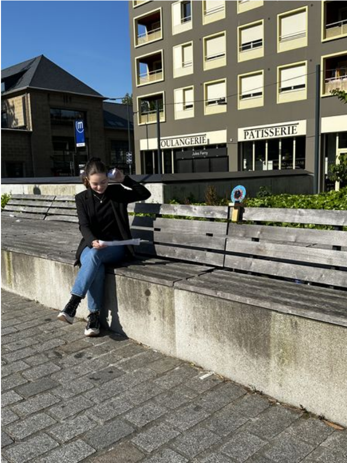
Taille de cet aperçu : 450 × 600 pixels. Fichier d'origine (3 024 × 4 032 pixels, taille du fichier : 3,78 Mio, type MIME : image/jpeg) Focalisation_IMG_3619_2