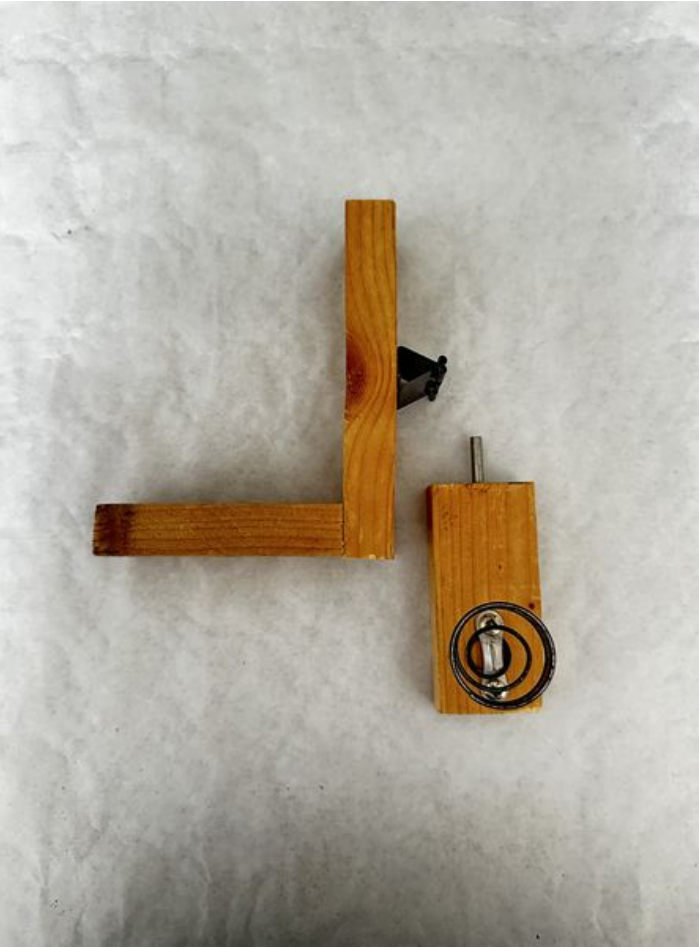
Taille de cet aperçu : 444 × 600 pixels. Fichier d'origine (2 984 × 4 032 pixels, taille du fichier : 1,32 Mio, type MIME : image/jpeg) Focalisation_IMG_3586_2