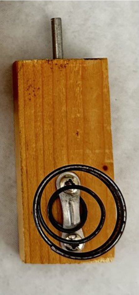
Taille de cet aperçu : 285 × 599 pixels. Fichier d'origine (676 × 1 420 pixels, taille du fichier : 229 Kio, type MIME : image/jpeg) Focalisation_IMG_3586