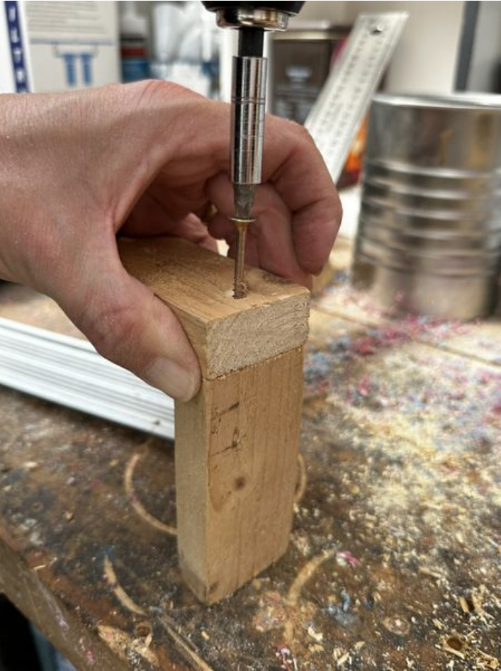
Taille de cet aperçu : 450 × 600 pixels. Fichier d'origine (3 024 × 4 032 pixels, taille du fichier : 2,3 Mio, type MIME : image/jpeg) Focalisation_IMG_3564_2