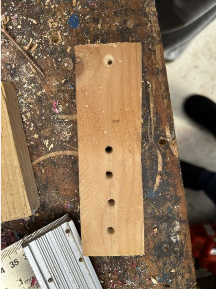
Taille de cet aperçu : 450 × 600 pixels. Fichier d'origine (3 024 × 4 032 pixels, taille du fichier : 2,96 Mio, type MIME : image/jpeg) Focalisation_IMG_3561