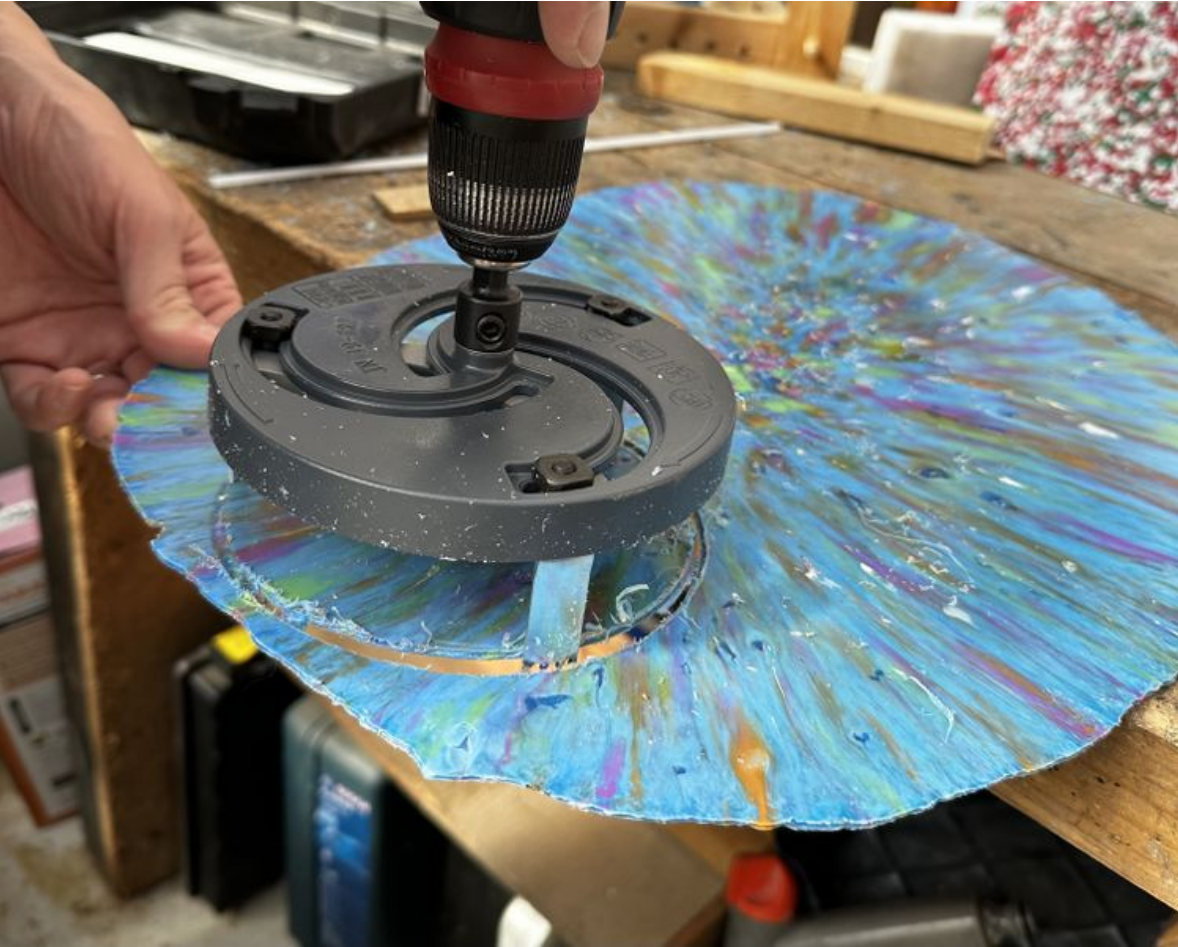
Taille de cet aperçu : 750 × 600 pixels. Fichier d'origine (3 024 × 2 419 pixels, taille du fichier : 1,39 Mio, type MIME : image/jpeg) Focalisation_IMG_3540