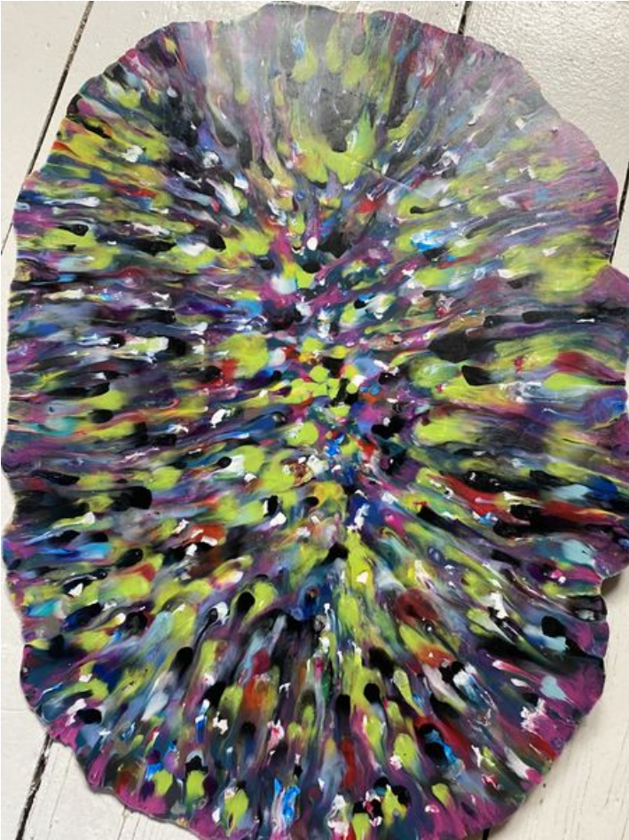
Taille de cet aperçu : 450 × 600 pixels. Fichier d'origine (3 024 × 4 032 pixels, taille du fichier : 3,05 Mio, type MIME : image/jpeg) Enclave_Plaque_1_Recto