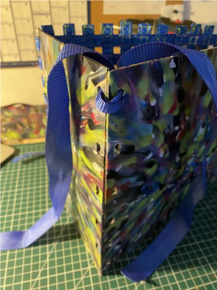
Taille de cet aperçu : 450 × 600 pixels. Fichier d'origine (3 024 × 4 032 pixels, taille du fichier : 2,26 Mio, type MIME : image/jpeg) Enclave_IMG_5152