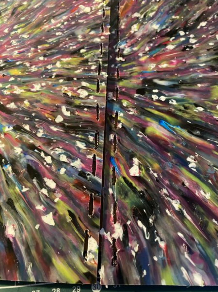
Taille de cet aperçu : 450 × 600 pixels. Fichier d'origine (3 024 × 4 032 pixels, taille du fichier : 2,74 Mio, type MIME : image/jpeg) Enclave_IMG_5148