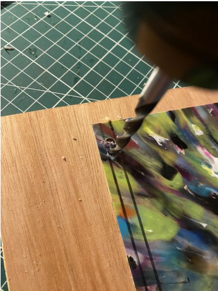
Taille de cet aperçu : 450 × 600 pixels. Fichier d'origine (3 024 × 4 032 pixels, taille du fichier : 2,59 Mio, type MIME : image/jpeg) Enclave_IMG_5139