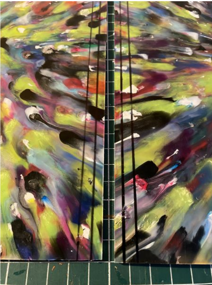
Taille de cet aperçu : 450 × 600 pixels. Fichier d'origine (3 024 × 4 032 pixels, taille du fichier : 2,47 Mio, type MIME : image/jpeg) Enclave_IMG_5137