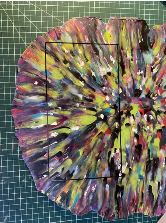
Taille de cet aperçu : 450 × 600 pixels. Fichier d'origine (3 024 × 4 032 pixels, taille du fichier : 3,04 Mio, type MIME : image/jpeg) Enclave_IMG_5134