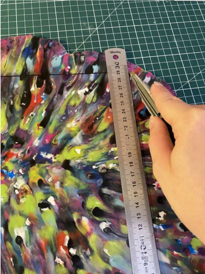
Taille de cet aperçu : 450 × 600 pixels. Fichier d'origine (3 024 × 4 032 pixels, taille du fichier : 2,77 Mio, type MIME : image/jpeg) Enclave_IMG_5132