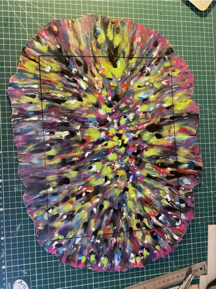
Taille de cet aperçu : 450 × 600 pixels. Fichier d'origine (3 024 × 4 032 pixels, taille du fichier : 3,28 Mio, type MIME : image/jpeg) Enclave_IMG_5130