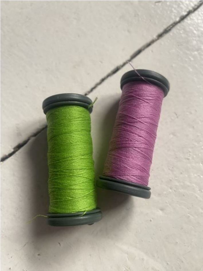
Taille de cet aperçu : 450 × 600 pixels. Fichier d'origine (3 024 × 4 032 pixels, taille du fichier : 1,92 Mio, type MIME : image/jpeg) Enclave_IMG_4994