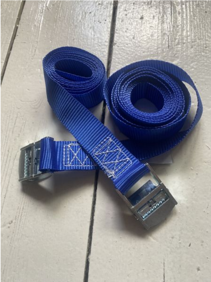
Taille de cet aperçu : 450 × 600 pixels. Fichier d'origine (3 024 × 4 032 pixels, taille du fichier : 2,5 Mio, type MIME : image/jpeg) Enclave_IMG_4992