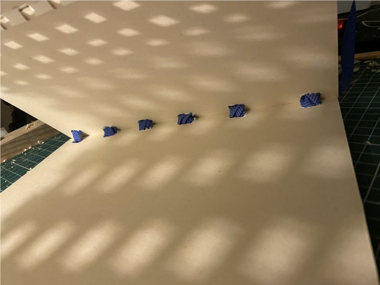
Taille de cet aperçu : 800 × 600 pixels. Fichier d'origine (4 032 × 3 024 pixels, taille du fichier : 1,97 Mio, type MIME : image/jpeg) Enclave_IMG_4962_2