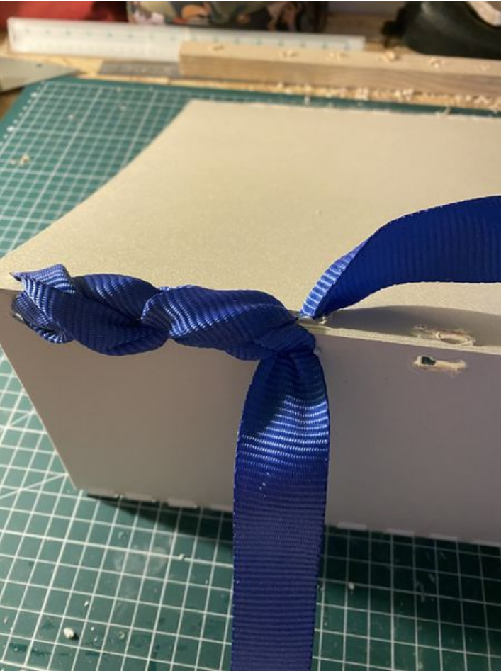
Taille de cet aperçu : 450 × 600 pixels. Fichier d'origine (3 024 × 4 032 pixels, taille du fichier : 2,27 Mio, type MIME : image/jpeg) Enclave_IMG_4959_3