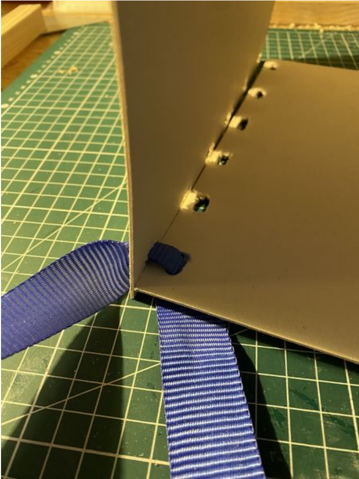
Taille de cet aperçu : 450 × 600 pixels. Fichier d'origine (3 024 × 4 032 pixels, taille du fichier : 2,4 Mio, type MIME : image/jpeg) Enclave_IMG_4956