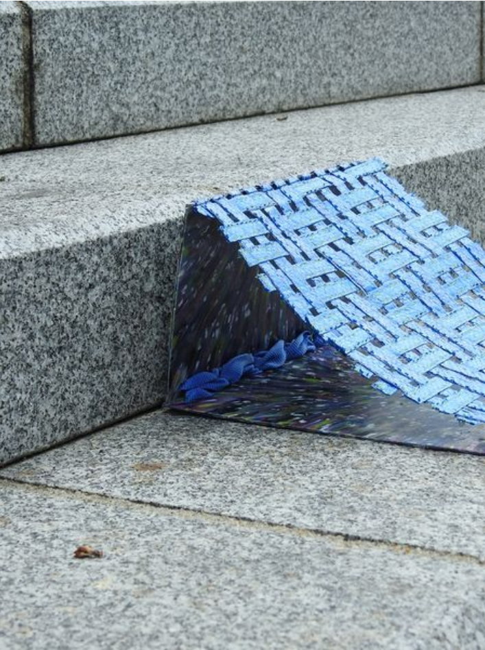
Taille de cet aperçu : 450 × 600 pixels. Fichier d'origine (3 456 × 4 608 pixels, taille du fichier : 3,48 Mio, type MIME : image/jpeg) Enclave_DSCN2033