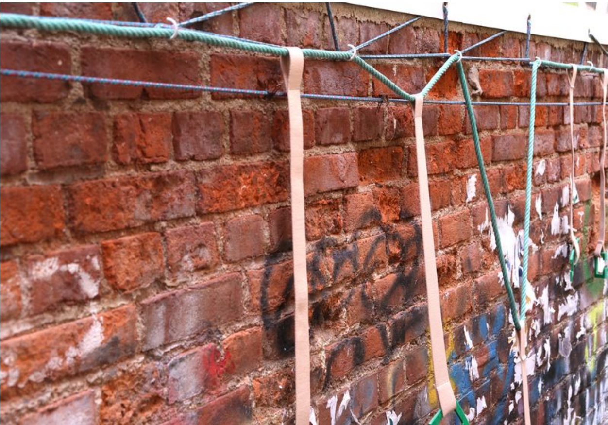
Taille de cet aperçu : 800 × 556 pixels. Fichier d'origine (5 750 × 3 998 pixels, taille du fichier : 13,27 Mio, type MIME : image/jpeg) DropLine_le_porte_manteau_urbain_IMG_7298