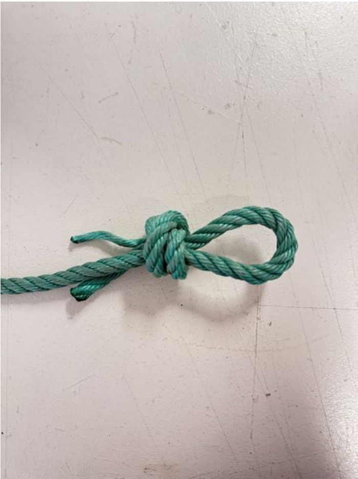
Taille de cet aperçu : 450 × 600 pixels. Fichier d'origine (4 284 × 5 712 pixels, taille du fichier : 5,45 Mio, type MIME : image/jpeg) DropLine_le_porte_manteau_urbain_IMG_3404