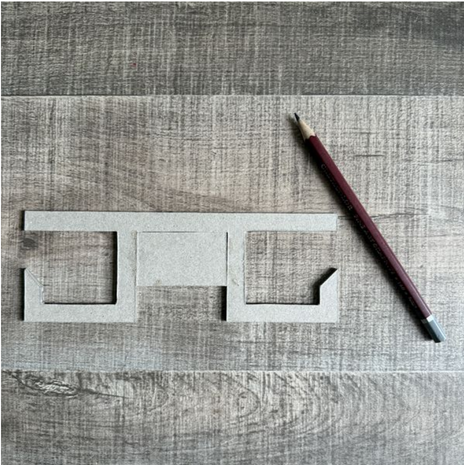
Taille de cet aperçu : 600 × 600 pixels. Fichier d'origine (4 284 × 4 284 pixels, taille du fichier : 6,89 Mio, type MIME : image/jpeg) DropLine_le_porte_manteau_urbain_IMG_3388