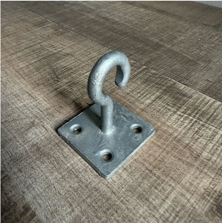
Taille de cet aperçu : 600 × 600 pixels. Fichier d'origine (3 024 × 3 024 pixels, taille du fichier : 3,7 Mio, type MIME : image/jpeg) DropLine_le_porte_manteau_urbain_IMG_3385