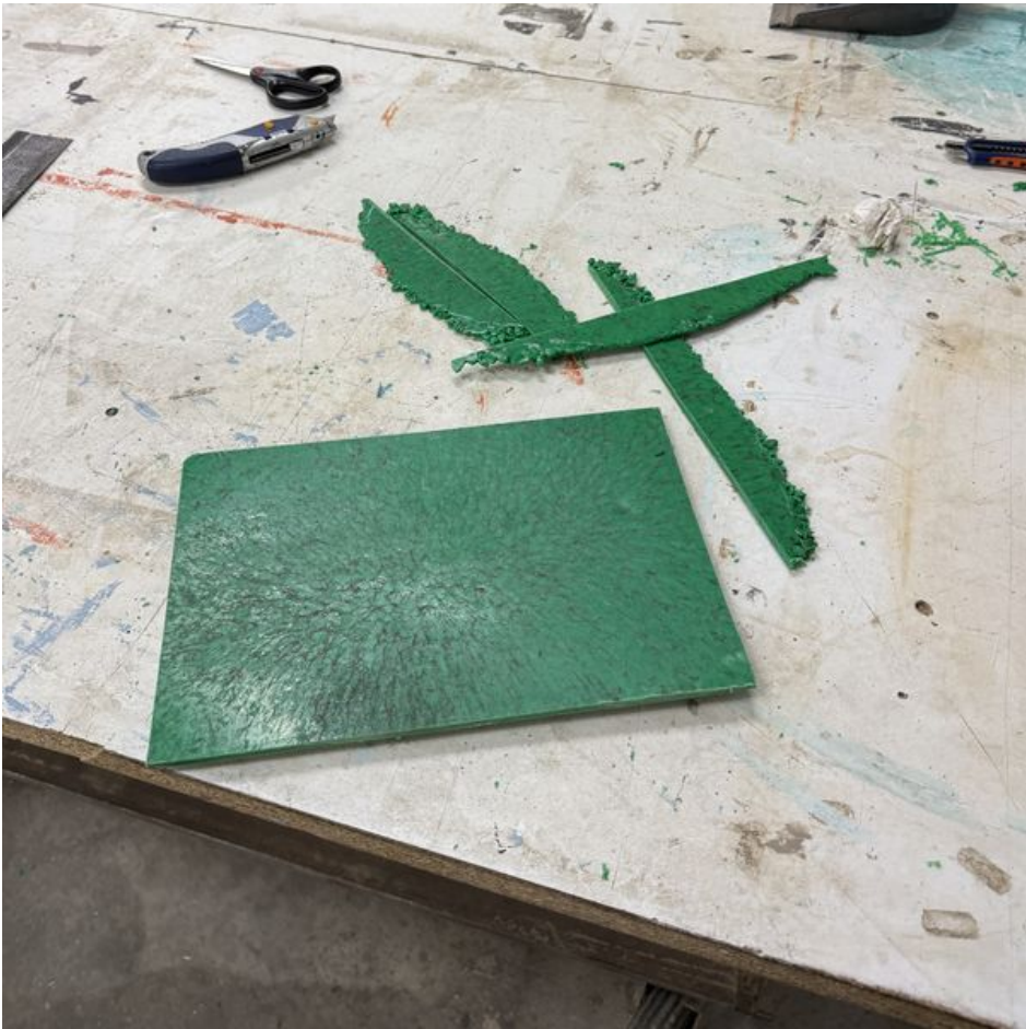
Taille de cet aperçu : 600 × 600 pixels. Fichier d'origine (3 845 × 3 845 pixels, taille du fichier : 4,24 Mio, type MIME : image/jpeg) DropLine_le_porte_manteau_urbain_IMG_2793