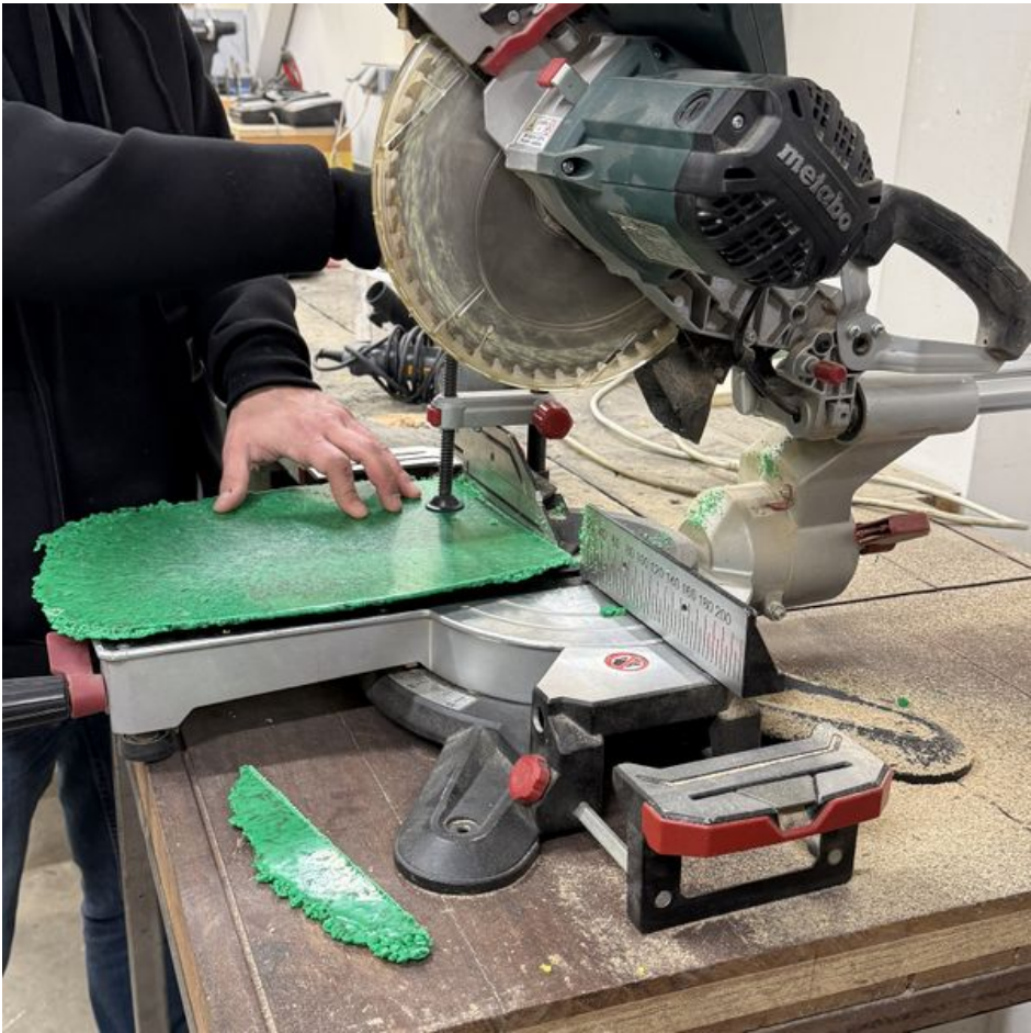
Taille de cet aperçu : 600 × 600 pixels. Fichier d'origine (3 015 × 3 015 pixels, taille du fichier : 3,11 Mio, type MIME : image/jpeg) DropLine_le_porte_manteau_urbain_IMG_2791