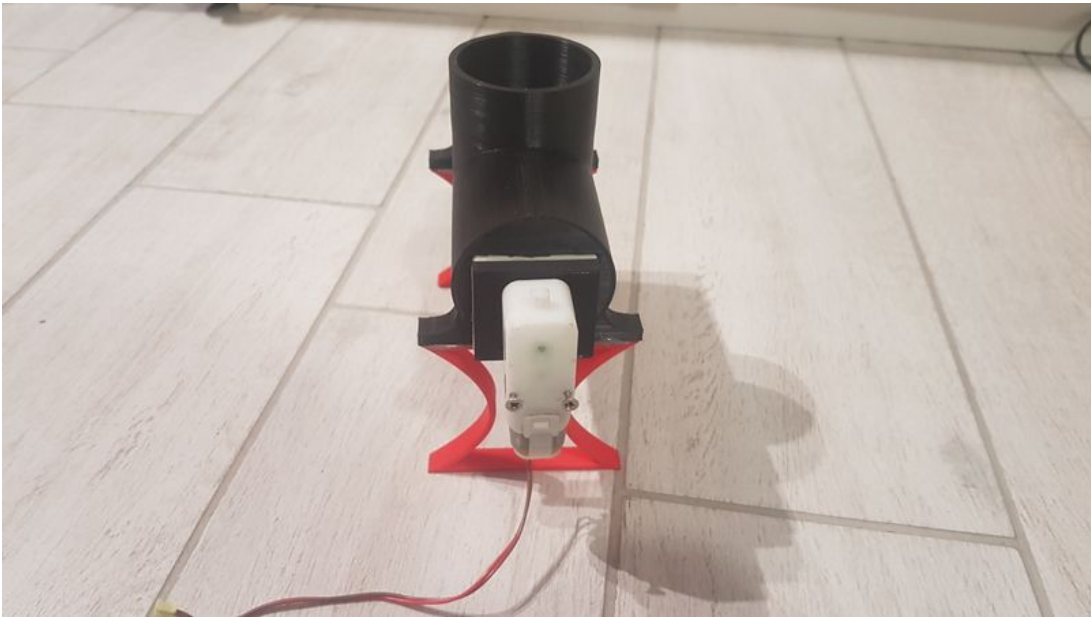
Taille de cet aperçu : 800 × 450 pixels. Fichier d'origine (4 032 × 2 268 pixels, taille du fichier : 2,58 Mio, type MIME : image/jpeg) distributeur_de_croquette_chat_arduino_20210115_221901