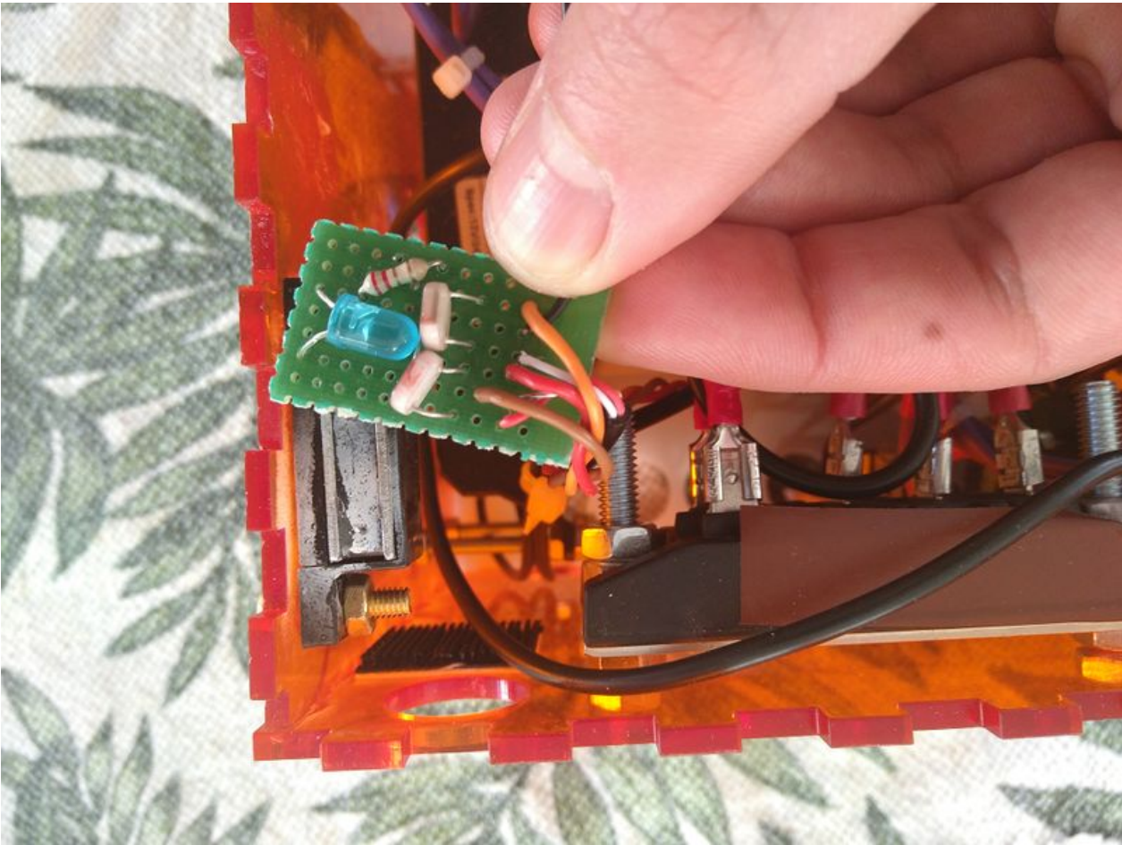
Taille de cet aperçu : 800 × 600 pixels. Fichier d'origine (4 096 × 3 072 pixels, taille du fichier : 4,29 Mio, type MIME : image/jpeg) Cyclo_Projecteur_IMG_20200323_164053