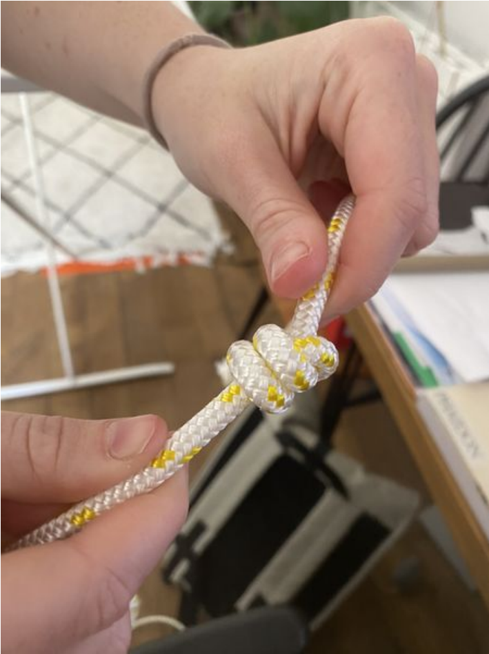
Taille de cet aperçu : 450 × 600 pixels. Fichier d'origine (3 024 × 4 032 pixels, taille du fichier : 1,85 Mio, type MIME : image/jpeg) Corps__corde_IMG_8447