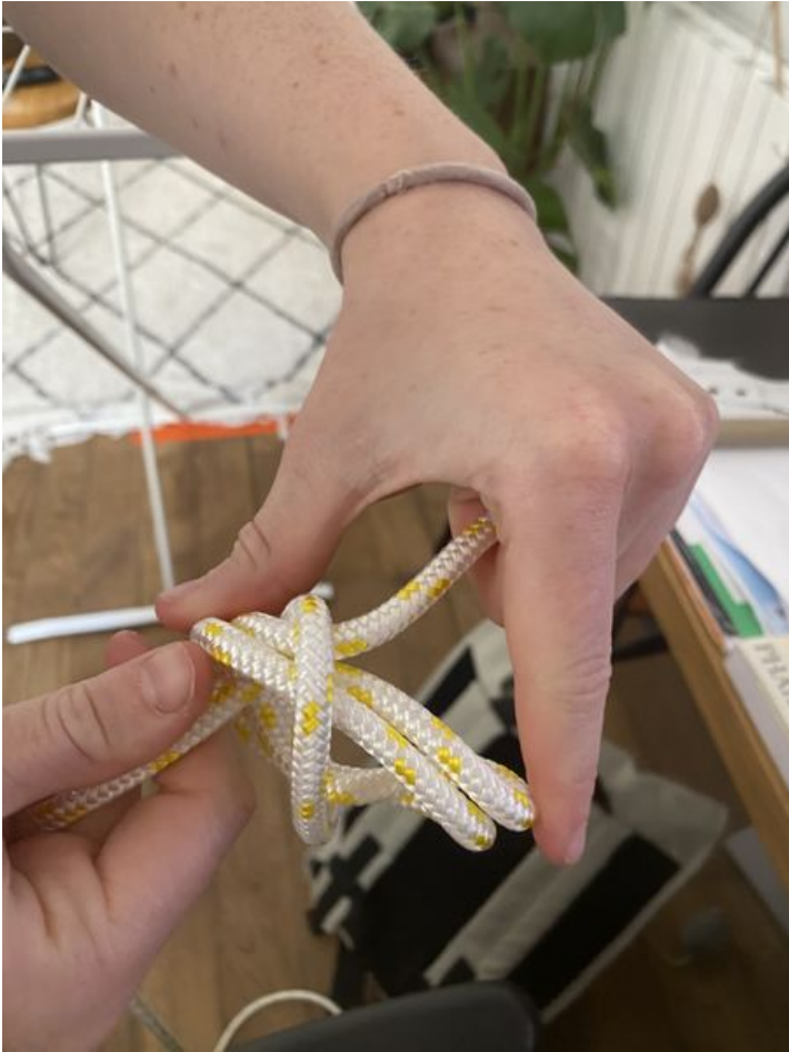
Taille de cet aperçu : 450 × 600 pixels. Fichier d'origine (3 024 × 4 032 pixels, taille du fichier : 1,82 Mio, type MIME : image/jpeg) Corps__corde_IMG_8444